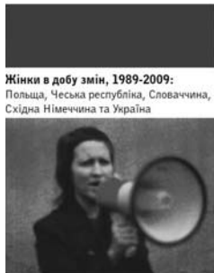
Жінки в добу змін, 1989-2009: Польща, Чеська республіка, Словаччина, Східна Німеччина та Україна